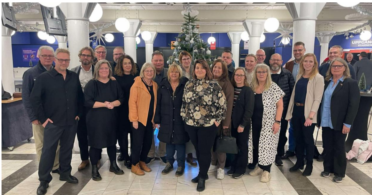
S-regiongruppen nov 2024

Regiongruppen har varit aktiva i EU-valrörelsen. Insatser skedde bland annat med dörrknackningar i Mönsterås och Vimmerby. I maj genomfördes en särskild utbildningsdag om EU ur ett regionalt perspektiv med besök ifrån vårt eget brysselkontor. Regiongruppen har också deltagit i arbetarekommunernas olika kampanjaktiviteter under hela året.